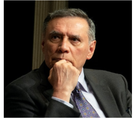
JAMIL MAHUAD EXPRESIDENTE DE ECUADOR

“Este debate no ha hecho nada más que empezar, vamos a tener un poco de paciencia... ¿Qué es lo que está complicando hasta extremos increíbles la realidad actual?, la revolución tecnológica... La materia prima del oligopolio de oferta de las grandes tecnológicas son los datos personales de todos los presentes, más de los 2700 millones que están en la materia prima, son nuestros datos personales desde que nacemos hasta que nos morimos, ..., y es la primera vez que se monta el mayor negocio de la historia con una materia prima gratis, apropiada indebidamente, ... Es lo que está detrás de todo lo que ocurre, además de segmentar la información, de ir a los gustos personales, a las preferencias, de desarticular la sociedad, utilizada también políticamente para dirigir la propaganda y la publicidad y no sé cuánto, pero aquí hay una respuesta dentro de este sistema de libertades que se llama economía de mercado... Usted no puede vivir de mis datos personales, no digo que los tiene que usar de manera respetuosa, es que sin mi autorización bien informada no los puede utilizar” ■