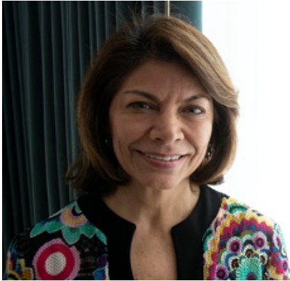
LAURA CHINCHILLA EXPRESIDENTE DE COSTA RICA

“Es una discusión delicada en la que están en juego muchos derechos, la libertad de expresión, pero también una serie de valores como la tolerancia, la privacidad, la información de parte de la gente... Cuando se aplican las plataformas para enviar mensajes automatizados en miles de miles conteniendo noticias falsas, desinformación o bien incentivando el discurso de odio tienden a ser mucho más dañinos en contextos en donde encontramos altos niveles de polinización, una prensa ya de por sí partidista y altos niveles de desconfianza en las instituciones del país, y muy bajos niveles de educación digital. Las respuestas tienen que ser montadas sobre la base de un conjunto de principios, y varias organizaciones ya trabajan al respecto, como la Comisión Interamericana Derechos Humanos... Creo que lo que importa es que recojamos estos valores, esos principios y entendamos esto, que nadie puede erigirse en único y exclusivo árbitro de este tema, ni un gobierno, ni una empresa tecnológica, pues son muchos los que tienen que participar de este debate de puertas abiertas” ■