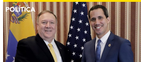
MIKE POMPEO, SECRETARIO DE ESTADO (USA) Y JUAN GUAIDÓ, PRESIDENTE ENCARGADO DE VENEZUELA.