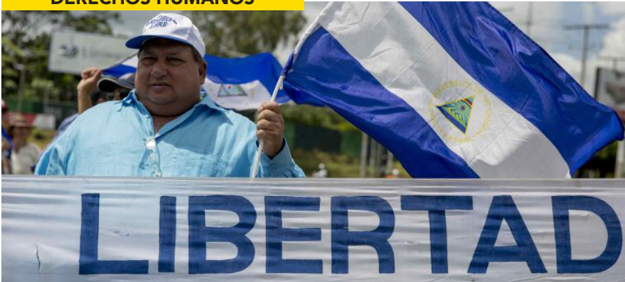
PERSONAS EXIGEN RESPETO POR LA LIBERTAD DE EXPRESIÓN EN MANAGUA, NICARAGUA.