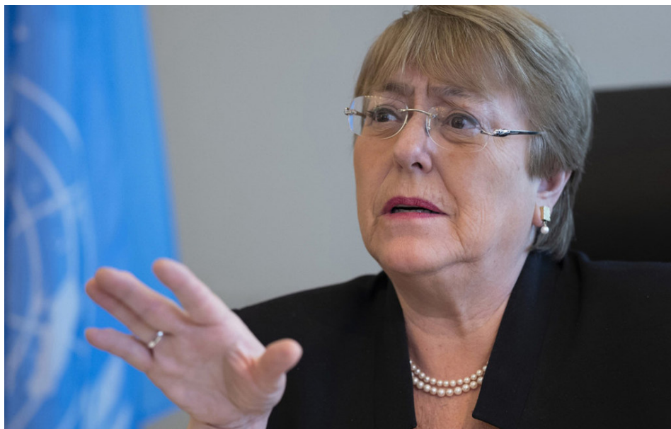
MICHEL BACHELET, ALTA COMISIONADA DE LA ONU PARA LOS DERECHOS HUMANOS.