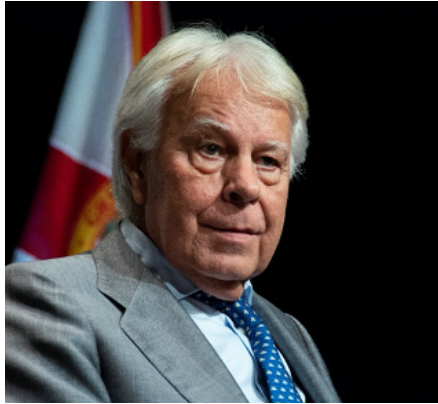
FELIPE GONZÁLEZ EXPRESIDENTE DEL GOBIERNO DE ESPAÑA

“Es una discusión delicada en la que están en juego muchos derechos, la libertad de expresión, pero también una serie de valores como la tolerancia, la privacidad, la información de parte de la gente... Cuando se aplican las plataformas para enviar mensajes automatizados en miles de miles conteniendo noticias falsas, desinformación o bien incentivando el discurso de odio tienden a ser mucho más dañinos en contextos en donde encontramos altos niveles de polinización, una prensa ya de por sí partidista y altos niveles de desconfianza en las instituciones del país, y muy bajos niveles de educación digital. Las respuestas tienen que ser montadas sobre la base de un conjunto de principios, y varias organizaciones ya trabajan al respecto, como la Comisión Interamericana Derechos Humanos... Creo que lo que importa es que recojamos estos valores, esos principios y entendamos esto, que nadie puede erigirse en único y exclusivo árbitro de este tema, ni un gobierno, ni una empresa tecnológica, pues son muchos los que tienen que participar de este debate de puertas abiertas” ■