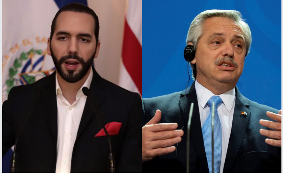
LOS MANDATARIOS NAYIB BUKELE DE EL SALVADOR Y ALBERTO FERNÁNDEZ DE ARGENTINA.