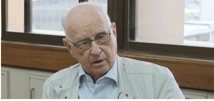
EL POLÍTICO VENEZOLANO ENRIQUE ARISTEGUIETA GRAMCKO.