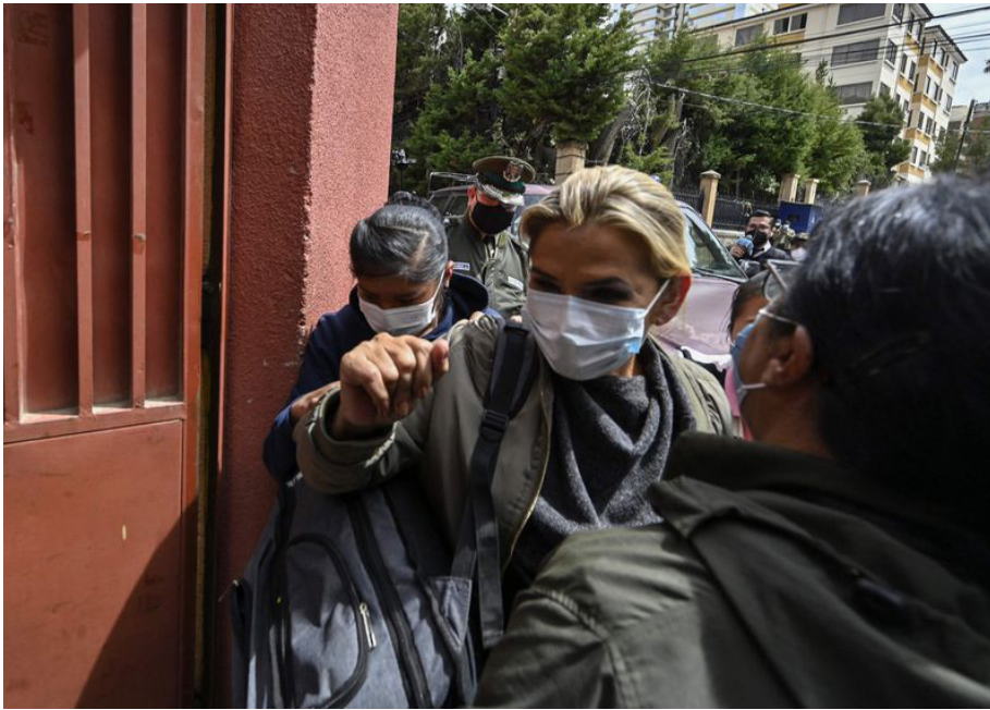
LA EXMANDATARIA JEANINE AÑEZ INGRESA A LA PRISIÓN DE OBRAJES EN LA PAZ.