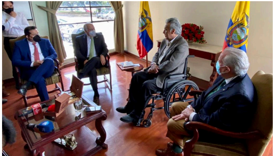
PRESIDENTE DEL ECUADOR, LENIN MORENO, RECIBE AL EXPRESIDENTE ANDRÉS PASTRANA Y SU DELEGACIÓN.

que pudiesen incidir sobre su imparcialidad, actuó con ejemplar eficacia y celeridad tanto al fijar las tendencias como al ofrecer los resultados finales, durante el mismo día de la jornada electoral. Es otro ejemplo que le da Ecuador al continente.