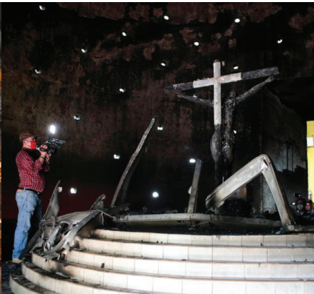
SANTA SOFÍA, TRANSFORMADA EN MEZQUITA MUSULMANA / CATEDRAL DE MANAGUA, LUEGO DEL ATENTADO TERRORISTA