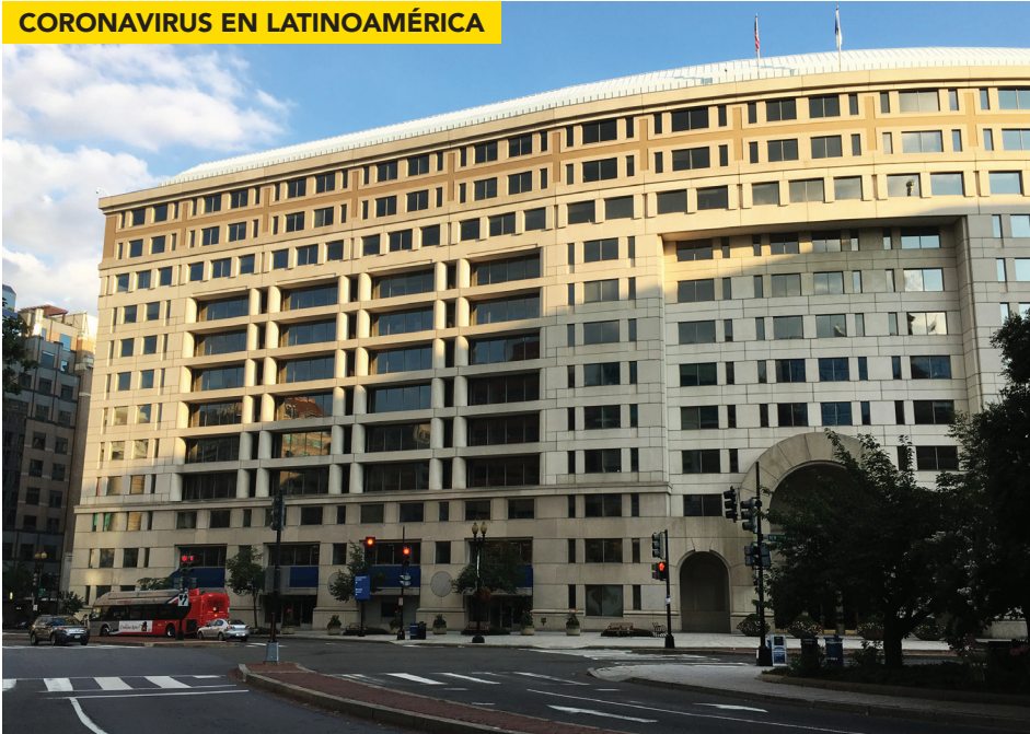
EL BANCO INTERAMERICANO DE DESARROLLO CON SEDE EN WASHINGTON.