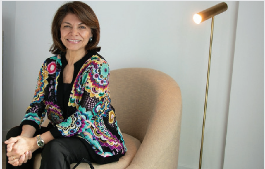
LAURA CHINCHILLA, COSTA RICA ENTRE EL 2010 Y EL 2014. (DLA/IDEA)

“No somos abstencionistas: no hay abstención cuando lo convocado no es una elección”, concluyen. E invitan “a la comunidad internacional a rechazar este nuevo intento de fraude que pretende ejecutar el régimen de Maduro en violación a los principios democráticos y a que nos continúen apoyando en nuestra lucha hasta que todos los venezolanos podamos de nuevo votar, confiando en que nuestro voto será contado en elecciones presidenciales y parlamentarias libres, justas y verificables” ■