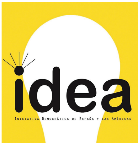
DECLARACIÓN DE 21 EX JEFES DE ESTADO Y DE GOBIERNO

“Como presidente, la política de “seguridad democrática” de Uribe unió a los colombianos, y su Plan Colombia recibió miles de millones en apoyo material de los Estados Unidos, poniendo a las Fuerzas Armadas Revolucionarias de Colombia (FARC) a la defensiva por primera vez en años. El senador izquierdista Iván Cepeda, con una educación comunista, entrenamiento búlgaro y una larga trayectoria defendiendo a las FARC, lleva años participado en una venganza contra Uribe y está empeñado en vincularlo con los paramilitares. Muchos se preguntarán cómo la misma Corte Suprema que bendijo a tribunales especiales para guerrilleros asesinos y ayudó al líder de las FARC, Jesús Santrich, a escapar de la justicia, ahora puede juzgar a Álvaro Uribe. La naturaleza procesal mundana de la acusación contra Uribe y su detención sin cargos formales son más signos de una cacería de brujas política. Son capaces de manipular el proceso judicial para destruir a un hombre al que no pudieron derrotar ni en el campo de batalla o el terreno electoral” ■