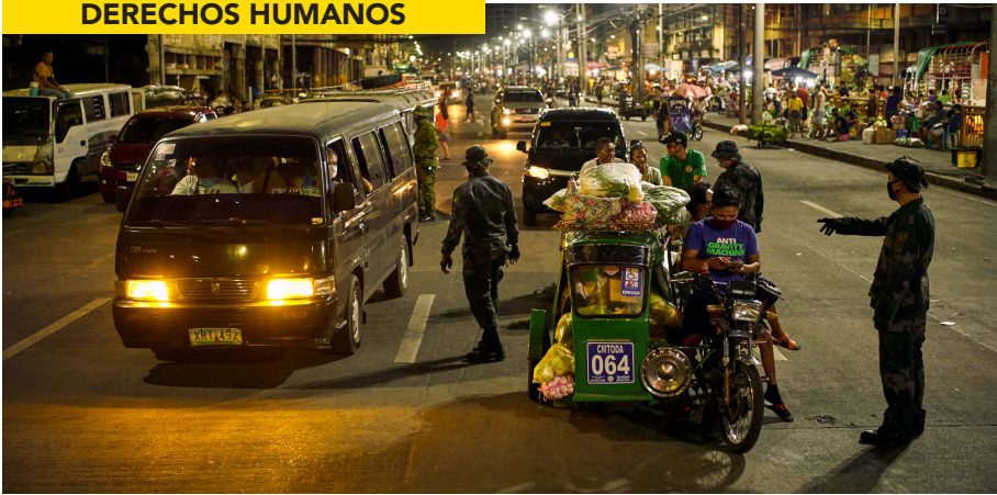
CONTROL POLICIAL DE MASCARILLAS. (NYT)