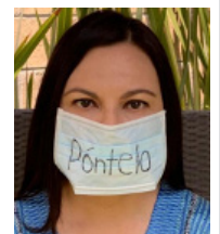
EL UNIVERSAL, CIUDAD DE MÉXICO

El subsecretario de salud de México, Hugo López-Gatell ha advertido que no han implementado el uso obligatorio del tapabocas por el Covid-19 por los abusos contra la población, destacando la muerte del joven Giovanni López en Guadalajara. ► PAG. 4