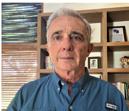
ÁLVARO URIBE V., EXPRESIDENTE DE COLOMBIA.