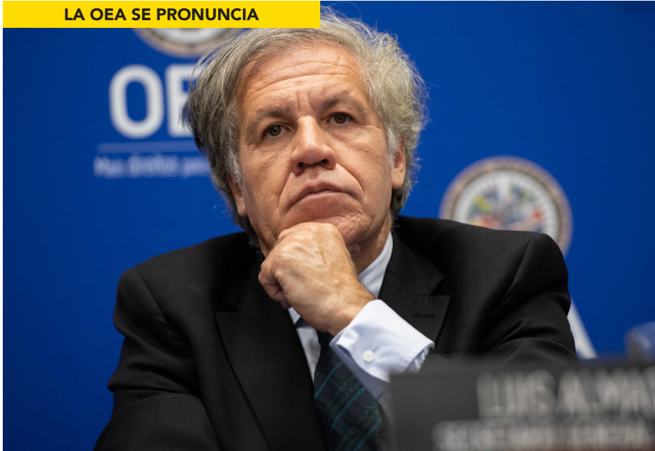
LUIS ALMAGRO, SECRETARIO GENERAL DE LA OEA.