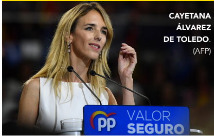
CAYETANA ÁLVAREZ DE TOLEDO.