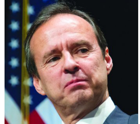
JORGE TUTO QUIROGA, EXPRESIDENTE DE BOLIVIA