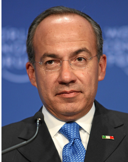
FELIPE CALDERÓN, EXPRESIDENTE DE MÉXICO