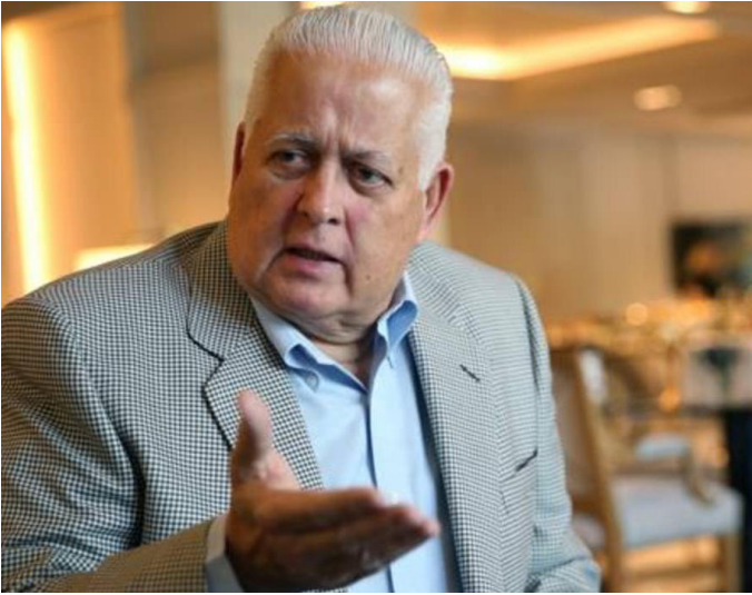
ERNESTO PÉREZ BALLADARES, EXPRESIDENTE DE PANAMÁ