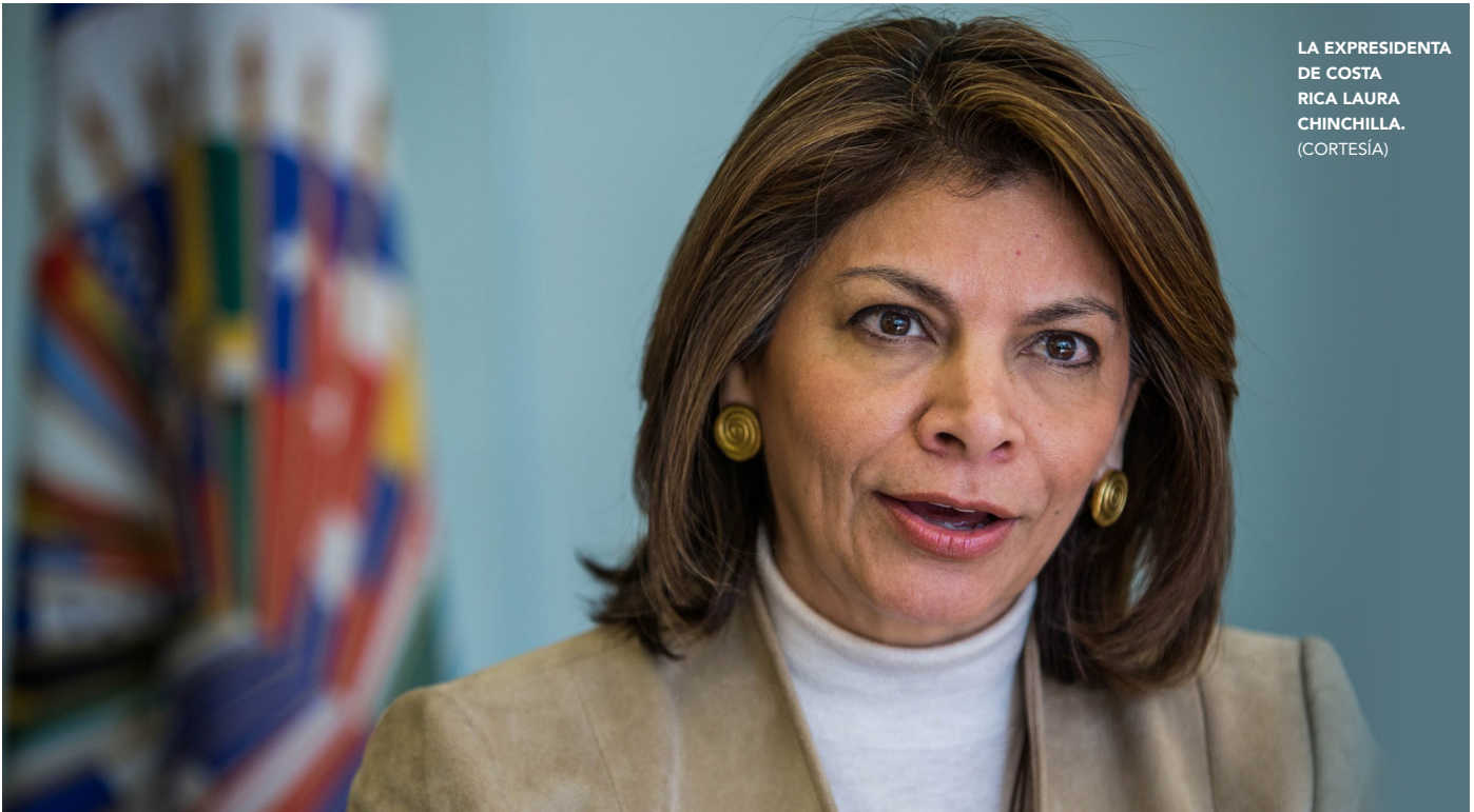
LA EXPRESIDENTA DE COSTA RICA LAURA CHINCHILLA.