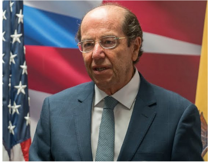
OSVALDO HURTADO, EXPRESIDENTE DE ECUADOR