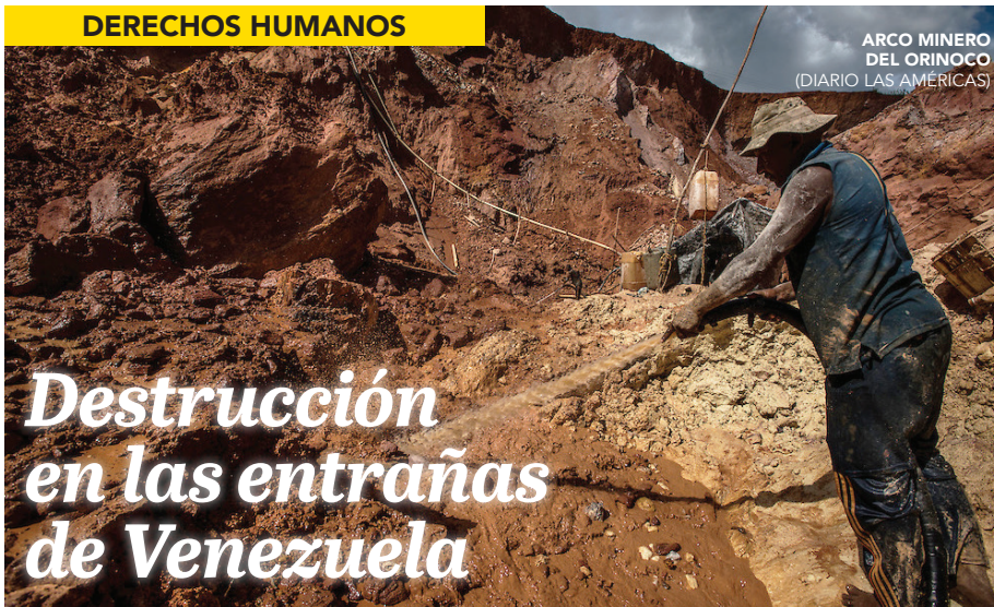
ARCO MINERO DEL ORINOCO (DIARIO LAS AMÉRICAS)