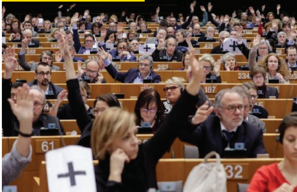
EL PARLAMENTO EUROPEO EXPIDE UNA DURA RESOLUCIÓN CONTRA EL RÉGIMEN DE MADURO.