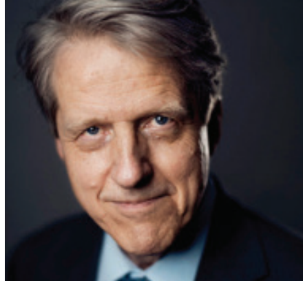
ROBERT SHILLER PREMIO NOBEL DE ECONOMÍA

“[H]a surgido una polémica acerca de las consecuencias adversas en materia económica y social que esa situación acarrearán... La idea es que, a través de la asistencia y apoyos estatales se evite la quiebra de múltiples empresas de todos los tamaños, conjurando así el deterioro y merma del aparato productivo, e impidiendo que la población más golpeada por el confinamiento sufra situaciones de extrema penuria, ... Una vez superado el alto riesgo de contaminación y diseminación del mal generado... se requiere que los Estados jueguen un papel fundamental para sacar a las economías de la fase de letargo y depresión... En este sentido, es fundamental que los gobiernos se aboquen a la puesta en marcha de programas y acciones que estimulen la demanda, porque si no hay demanda no se reactivará la actividad productiva, ni se crearán nuevas oportunidades de empleo en las cantidades requeridas para reducir de forma efectiva el masivo desempleo actual... ¿Significa esto el retorno del welfare state? Podemos decir que sí, pero con un carácter de transitoriedad, selectivo y no universal” ■