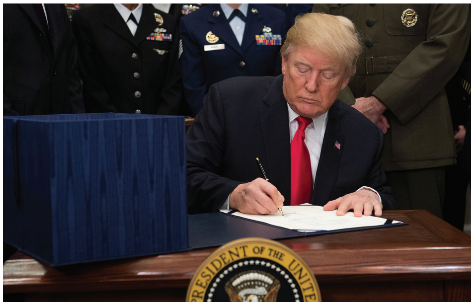
DONALD TRUMP, FIRMA LA ORDEN EJECUTIVA QUE REDUCE EL PODER DE LAS PLATAFORMAS DIGITALES.

La literatura sobre Fake News fija como su origen la campaña electoral que da la victoria al actual ocupante de la Casa Blanca, a quien ve como ícono de la mentira. Donald Trump ahora reacciona contra las redes y les quita toda inmunidad judicial