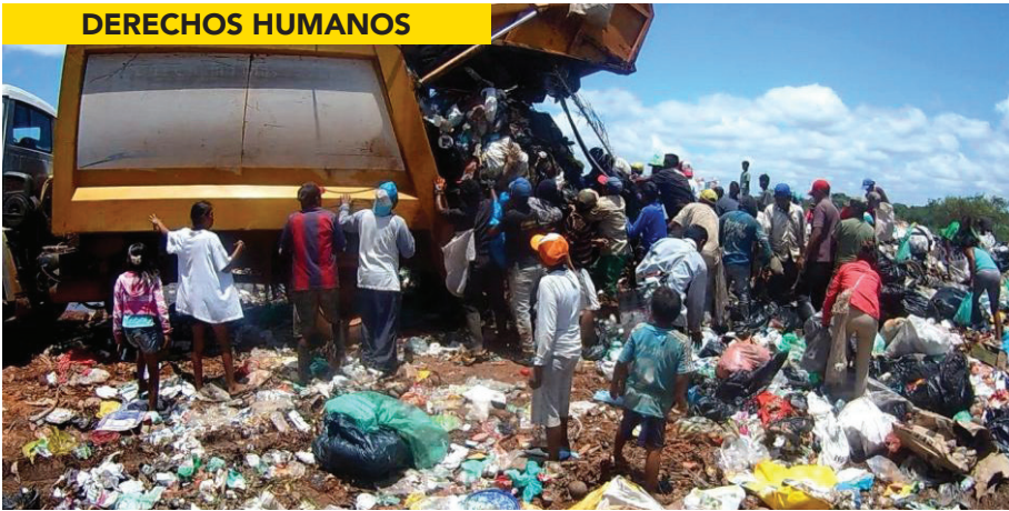
UN GRUPO DE PERSONAS, INCLUYENDO NIÑOS, BUSCAN COMIDA ENTRE LA BASURA EN VENEZUELA.