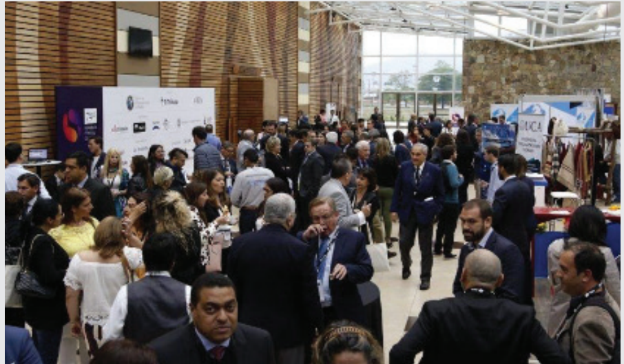
REUNIÓN DE LA SIP, SALTA, ARGENTINA

Entre tanto, las redes suben fotos de una misma joven a la que se le cambia el texto original para decirle a Uribe: “Te metiste con la generación equivocada” ■