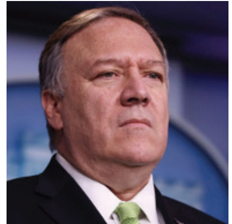
MIKE POMPEO, SECRETARIO DE ESTADO, USA

“Es muy difícil sacar a Maduro por medio del voto, pero hay que transitar ese camino muy tortuoso. En Nicaragua Daniel Ortega aceptó hacer elecciones en 1987, bajo la premisa de que si no había democracias en la región la paz sería imposible. Uno no puede pensar que la ONU pueda llevar adelante una invasión, que no apoyarían Rusia y China. Los venezolanos no tienen apoyo de los demócratas en USA para eso. Yo tampoco estoy de acuerdo. Lo que les queda es el campo electoral. Ortega, o aceptaba el Plan de Paz, apoyado por el Centro Carter, o la ayuda a la contra continuaría. Cada día que pasaba Nicaragua era más pobre. Venezuela es un narcoestado con un gobierno socialista que ha arruinado la economía, y al igual que lo piensa Cuba cree Maduro que los hambrientos no se revelan. Castro le aconsejaba a Ortega no hacer elecciones, porque las perdería. Imagino que los venezolanos deben decidir ir a las elecciones, si son más o menos limpias. Maduro cayó en las manos de Cuba y en Venezuela no se toma una decisión sin la autorización de los cubanos. El control sobre los militares es todopoderoso” ■