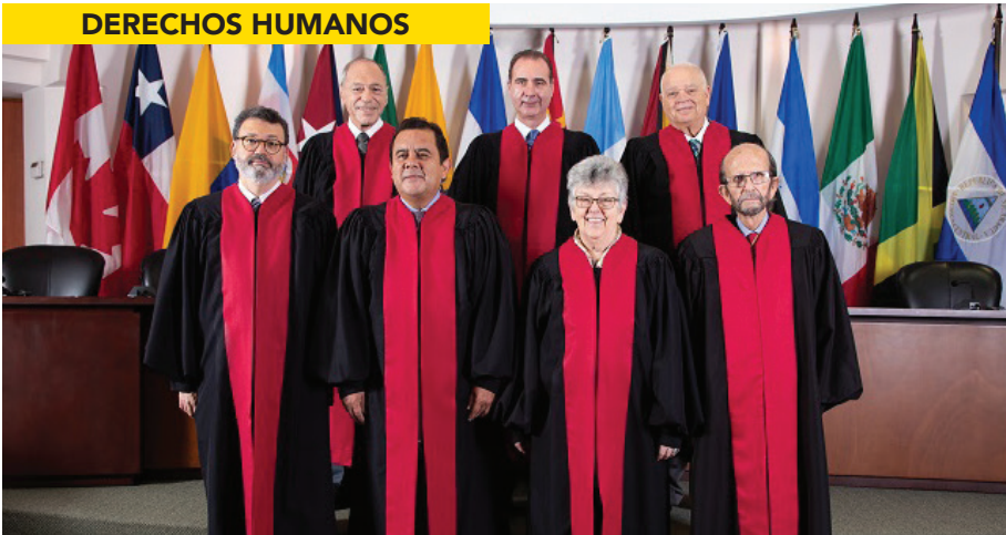
JUECES DE LA CORTE INTERAMERICANA.