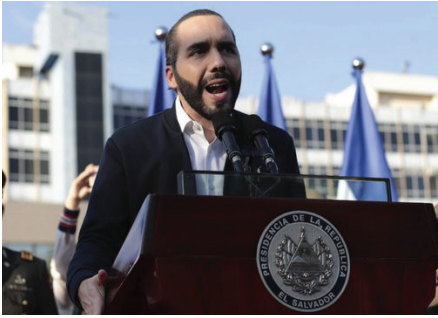
EL PRESIDENTE DE EL SALVADOR, NAYIB BUKELE.

“Un acto tan violento difícilmente se borrará de la memoria nacional”, señala El Faro