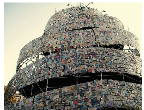
OBRA DE MARTA MINUJIN, TORRE DE BABEL DE LIBROS, BUENOS AIRES, 2011.

a la materialidad espacial y temporal que le da fundamento al poder político organizado, a los Estados como asientos de las naciones y molde de la cultura moderna. La pandemia y el distanciamiento social, para colmo, nos repliega y divide aún más. El género humano se vuelve en la circunstancia miríadas de nichos familiares, como en una suerte de adiestramiento para lo que se anuncia y predicán los intelectuales del progresismo, la globalización de las minorías. La unidad del género humano es antigua, para el progresismo y evita la naciente lucha entre clases nuevas. La globalización del Babel resucitado, la de los afrodescendientes, pueblos originarios, verdes o ambientalistas, sectas de esotéricos, tribus urbanas, LGBT, abortistas, relativistas, y párese de contar ■