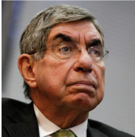
OSCAR ARIAS, PREMIO NOBEL DE LA PAZ

“Maduro no aceptará una elección limpia y mucho menos una derrota. Hoy le dicen ustedes al poder de facto, respete la Constitución. Desde hace mucho tiempo que no la respetan. Pero particularmente la vulneran a partir de diciembre de 2015, cuando pierden la Asamblea Nacional y empieza un proceso continuo de autogolpes. Si el diálogo es para ganar un tiempo para la dictadura que Venezuela no tiene, el diálogo no servirá. No puede haber diálogo con esos políticos. No puede haber diálogo con inhabilitados. No puede haber diálogo negando los derechos de la Asamblea Nacional. El pueblo venezolano ha sido siempre, históricamente, raro. Lo único que les puedo decir es que resistan. Venezuela es «un tumor que se expande por las democracias latinoamericanas». Lo tienen más difícil. Pero tienen instrumentos que los van a llevar a conseguir la libertad para todos. Hoy puedo decir en este momento, estamos en el umbral que conduce al final de la dictadura. El régimen está dividido y no todos los militares lo sostienen” ■