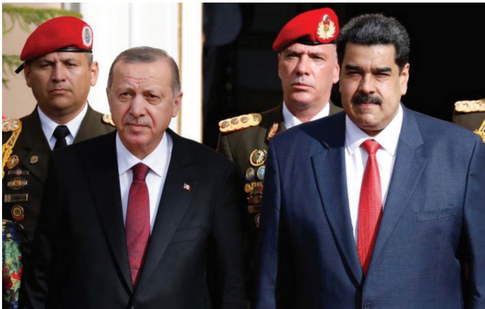
NICOLÁS MADURO (VENEZUELA) Y TAYYIP ERDOGAN (TURQUÍA).