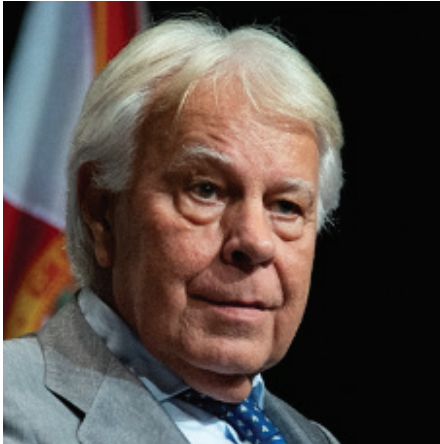
FELIPE GONZÁLEZ, EXPRESIDENTE DEL GOBIERNO DE ESPAÑA

“Maduro no aceptará una elección limpia y mucho menos una derrota. Hoy le dicen ustedes al poder de facto, respete la Constitución. Desde hace mucho tiempo que no la respetan. Pero particularmente la vulneran a partir de diciembre de 2015, cuando pierden la Asamblea Nacional y empieza un proceso continuo de autogolpes. Si el diálogo es para ganar un tiempo para la dictadura que Venezuela no tiene, el diálogo no servirá. No puede haber diálogo con esos políticos. No puede haber diálogo con inhabilitados. No puede haber diálogo negando los derechos de la Asamblea Nacional. El pueblo venezolano ha sido siempre, históricamente, raro. Lo único que les puedo decir es que resistan. Venezuela es «un tumor que se expande por las democracias latinoamericanas». Lo tienen más difícil. Pero tienen instrumentos que los van a llevar a conseguir la libertad para todos. Hoy puedo decir en este momento, estamos en el umbral que conduce al final de la dictadura. El régimen está dividido y no todos los militares lo sostienen” ■