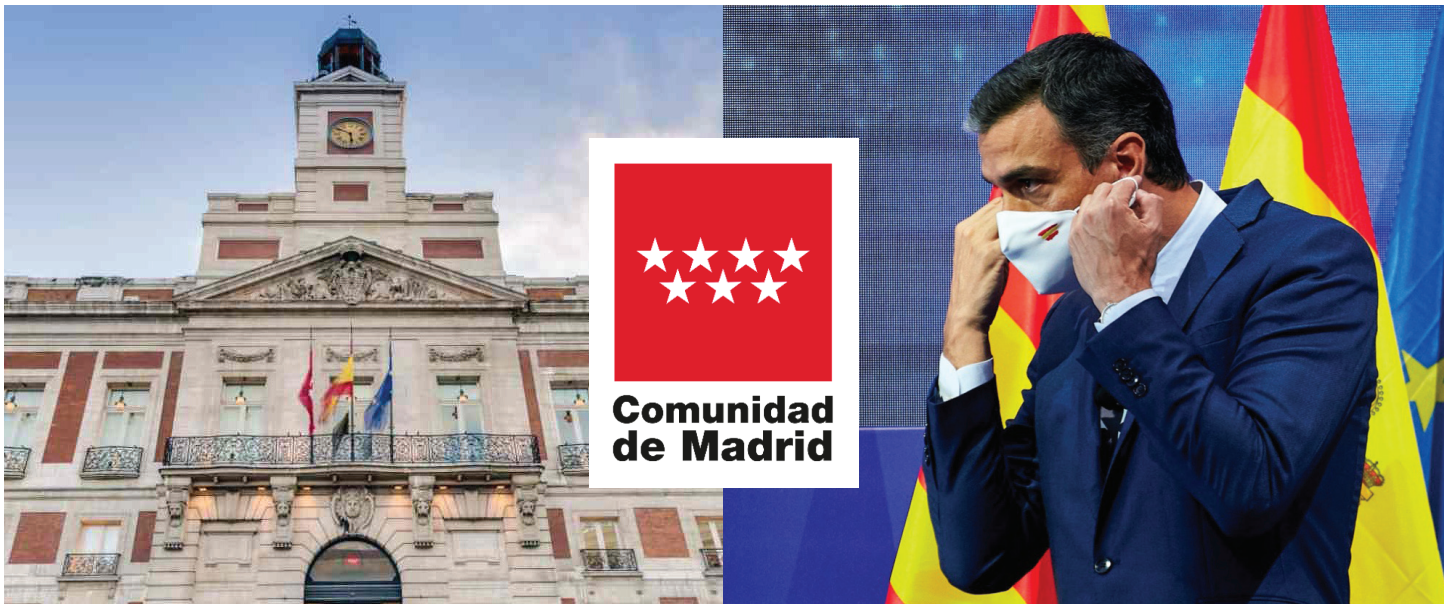
LA PUERTA DEL SOL EN MADRID.

El 23 de junio, la Comunidad de Madrid, que es la tercera más poblada de España y formante del área metropolitana de la capital española con 6.779.000 habitantes, ha expresado su fuerte rechazo institucional a lo que considera un fraude a la ley, un atentado constitucional y un desacato del Tribunal Supremo: los indultos otorgados por el gobierno de Sánchez a los condenados por el intento de secesión de Cataluña