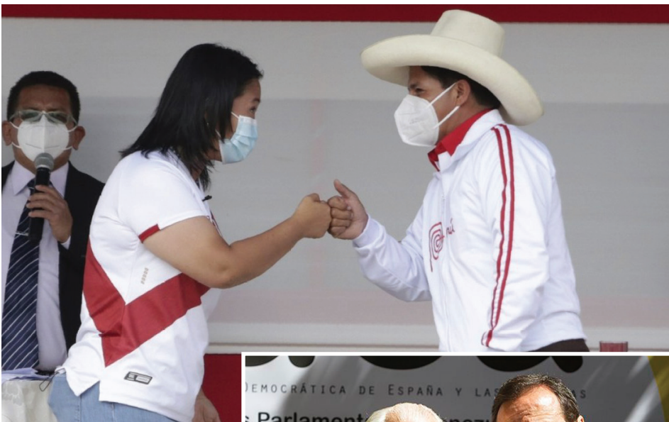
KEIKO FUJIMORI VS. PEDRO CASTILLO.

Keiko Fujimori y Perú Libre aportan documentación sobre los 800 pedidos de nulidad de actas de mesa de sufragio, que estarían comprometiendo 200.000 votos y sobre la anulación de votos que en su perjuicio habría hecho Fuerza Popular