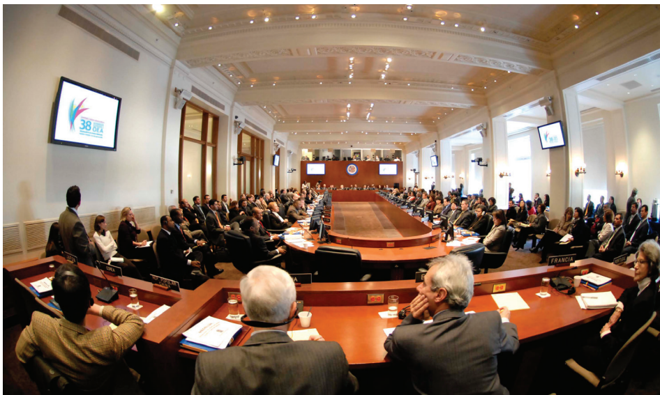
CONSEJO PERMANENTE DE LA OEA.

Trascurridos los 30 años de su monserga seminal, derrumbado el socialismo real en 1989, decide tirar al basurero su comunismo. Cambia de nombre, para seguir sobre la senda del «hamponato», esta vez oculto tras las faldas del «protagonismo popular». Asociado a Lula da Silva, usando ambos como mascarón de proa a la empresa Odebrecht, forjan al Foro de São Paulo. Y he allí los resultados. Están a la vista. He allí la razón de fondo para que se cambie de nuevo la franquicia, pasados otros 30 años, bajo la bandera de ese batiburrillo que se hace llamar Grupo de Puebla. Así se explica, no de otra manera, que ayer, no más, el Foro de São Paulo salga en defensa del dictador y criminal Daniel Ortega, y que Alberto Fernández retire la firma argentina sobre la denuncia ante la Corte Penal Internacional contra el régimen venezolano ■