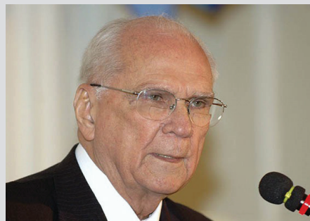
ENRIQUE BOLAÑOS GEYER (1928-2021).

Ingeniero, político y empresario, el presidente Bolaños, padre de cinco hijos y viudo, ligado al histórico partido liberal, dejó antes de su partida un compendio de la histórica nicaragüense que lleva por título La lucha por el poder: El poder o la guerra (Amazon, 2017) y en el que da cuenta de la “contienda fratricida entre los partidos políticos y entre sus caudillos por alcanzar el poder y atornillarse, si posible por toda la vida, en el sillón del poder ejecutivo”. Paz a su alma ■