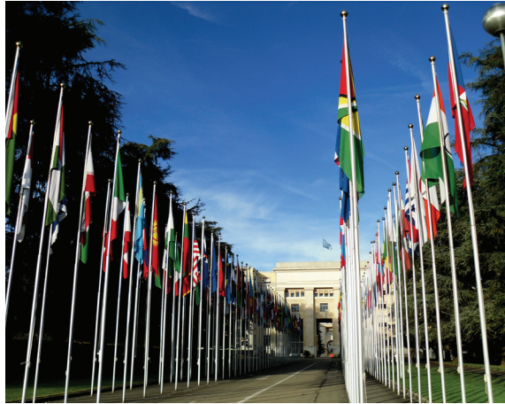
EL PALACIO DE LAS NACIONES EN SUIZA.

El texto del importante documento, que puede leerse en las redes ( https://www.icj.org/wp-content/uploads/2021/06/Venezuela-Judges-on-the-tightrope-Publications-Reports-Thematic-reports-2021-SPA.pdf ), observa en sus párrafos de conclusión que “las violaciones a la independencia judicial y las debilidades institucionales descritas en este informe han contribuido a promover la impunidad de las violaciones y abusos de derechos humanos en el país. El Poder Judicial también ha actuado como un instrumento que ha participado o facilitado graves violaciones de derechos humanos, tal y como fue documentado por la Misión Internacional Independiente para la Determinación de los Hechos en Venezuela (FFM). Además, se han detectado prácticas corruptas en el Poder Judicial, como “cobros” indebidos por parte de funcionarios judiciales para llevar a cabo procedimientos, así como jueces vinculados a empresas contratistas del Estado” ■