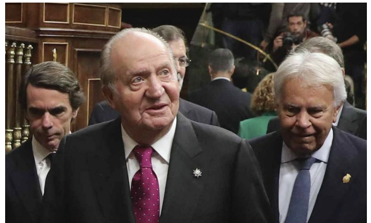
EN EL CONGRESO DE DIPUTADOS, 2018.

“Lo cual no quiere decir que me gusten parte o alguna de las políticas que han hecho o que no me gusten otras”, detalla Aznar, que reivindica que “hay otras cosas por encima de eso y esas deben prevalecer” ■