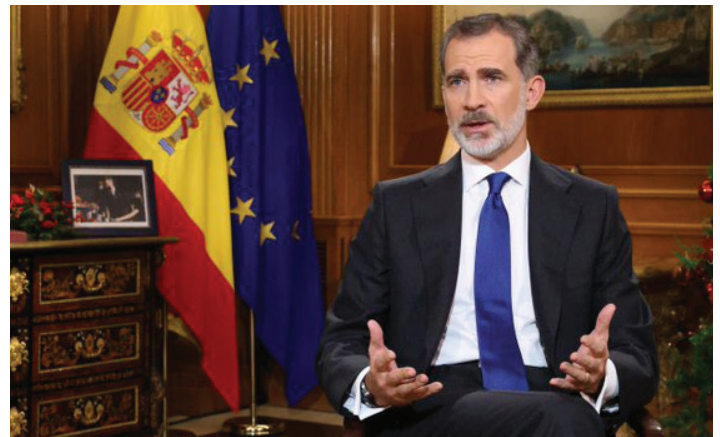
FELIPE VI: “EL CONGRESO PERMANECIÓ CAUTIVO POR LA ACTUACIÓN DE FUERZAS CONTRARIAS A LA LIBERTAD”.

–y cito textualmente– “todas las medidas necesarias para mantener el