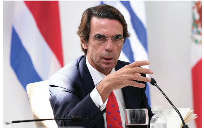
JOSÉ MARÍA AZNAR, EXPRESIDENTE DEL GOBIERNO DE ESPAÑA (1982-1996)

“Le voy a decir una cosa, yo nunca hubiese votado a Trump, nunca”, agrega el ex presidente del gobierno con motivo del 25º aniversario de la primera victoria del PP en España, en 1996, al ser entrevistado por Jordi Évole para LaSexta