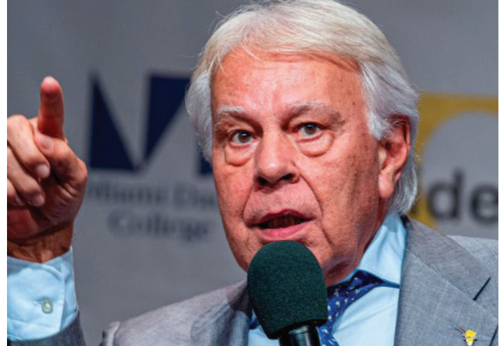
FELIPE GONZÁLEZ, EXPRESIDENTE DEL GOBIERNO DE ESPAÑA (1982-1996)

Si se nombraran las mejores democracias del mundo, nos encontraríamos con que la mayoría son monarquías parlamentarias, agrega el expresidente del gobierno español