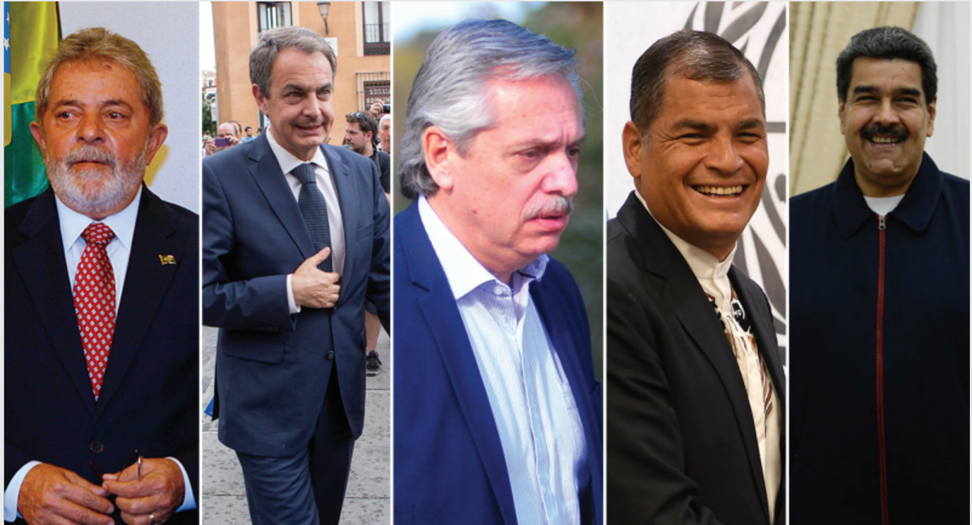
DE IZQ. A DER. EL EXPRESIDENTE DE BRASIL LUIZ INÁCIO LULA DA SILVA; EL EXPRESIDENTE DEL GOBIERNO ESPAÑOL JOSÉ LUIS RODRÍGUEZ ZAPATERO; EL ACTUAL PRESIDENTE DE ARGENTINA, ALBERTO FERNÁNDEZ; RAFAEL CORREA, EXPRESIDENTE DE ECUADOR; Y EL MANDATARIO VENEZOLANO NICOLÁS MADURO.