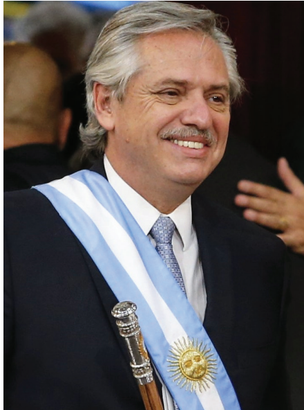
ALBERTO FERNÁNDEZ, PRESIDENTE DE ARGENTINA.

El empleo está colapsado, la pobreza orilla el 50%. Solo Venezuela, cuya economía se ha contraído casi 70% del producto desde 2016, tiene más pobreza que Argentina en la región. Los exportadores no pueden expor-