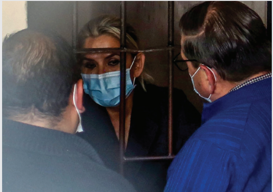
JEANINE AÑEZ, EX PRESIDENTA INTERINA DE BOLIVIA, CONVERSA CON SUS ABOGADOS DESDE LA CÁRCEL.

• Hacemos un llamado a la Organización de los Estados Americanos, al Alto Comisionado