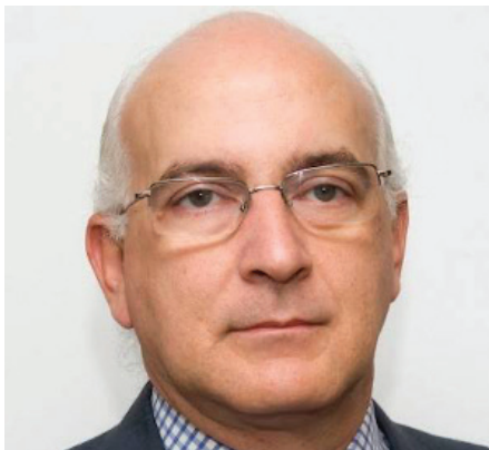
JAVIER ZARZALEJOS DIPUTADO EUROPEO, MIEMBRO DE FAES

“Israel se encuentra en la fase final de control con 15.550 enfermos confirmados, 208 muertos y 117 en cuidados intensivos. Nuestra población es joven, con una media de 30 años, esperándose que siga esa proyección hacia el año 2050. La situación es distinta en Europa, como España cuyo promedio de edad es de 41 años. Aun cuando Irán es el país más afectado de la región, pues mantuvo vuelos desde y hacia China, todos han tomado medidas estrechas para el confinamiento social. El estado de salud de esas poblaciones no es bueno. El gasto público de Israel no es muy alto en el área de la salud, pero ayudó esta vez el confinamiento, en el esfuerzo por doblegar la curva para que no fuese superior a 300 pacientes en UCIS. Pero la medida más importante fue el cierre de fronteras, que para nosotros fue fácil y tener un número de pruebas suficiente, 10.000 cada día y obtener resultados en 12 horas. Igualmente, el esfuerzo de rápida identificación de contagiados y contactos y su aislamiento, controlados a través de sus móviles. Salir de la crisis exigirá mantener un número bajo de casos” ■