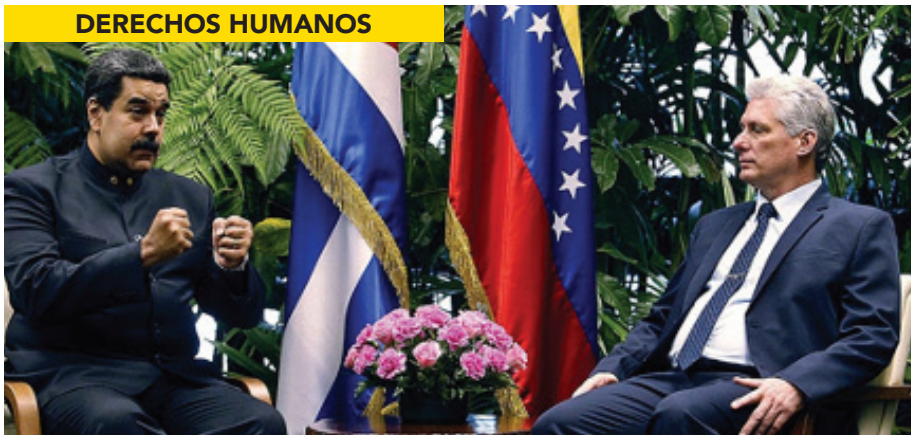
NICOLÁS MADURO Y MIGUEL DÍAZ-CANEL, DICTADORES DE VENEZUELA Y DE CUBA.