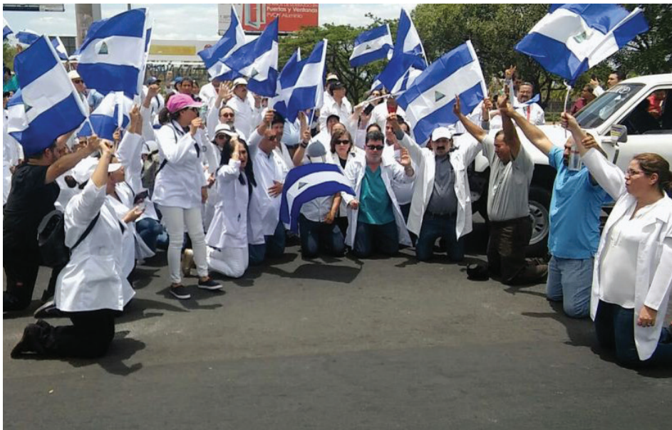
MÉDICOS NICARAGÜENSES EN PROTESTA POR EL DERECHO A LA VIDA. (IMAGEN REFERENCIAL/CORTESÍA)

Los profesionales de la salud han protestado la situación de abandono a la que han sido sometidos los nicaragüenses por el régimen de Ortega, agravada por el Covid-19 y denunciada por la Asamblea Legislativa de Costa Rica e Iniciativa Democrática de España y Las Américas (IDEA)