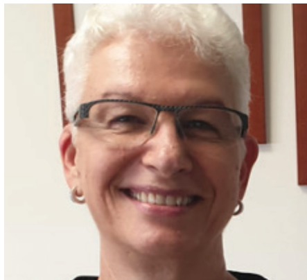
RODICA RADIAN-GORDON EMBAJADORA DE ISRAEL EN MADRID

“Israel se encuentra en la fase final de control con 15.550 enfermos confirmados, 208 muertos y 117 en cuidados intensivos. Nuestra población es joven, con una media de 30 años, esperándose que siga esa proyección hacia el año 2050. La situación es distinta en Europa, como España cuyo promedio de edad es de 41 años. Aun cuando Irán es el país más afectado de la región, pues mantuvo vuelos desde y hacia China, todos han tomado medidas estrechas para el confinamiento social. El estado de salud de esas poblaciones no es bueno. El gasto público de Israel no es muy alto en el área de la salud, pero ayudó esta vez el confinamiento, en el esfuerzo por doblegar la curva para que no fuese superior a 300 pacientes en UCIS. Pero la medida más importante fue el cierre de fronteras, que para nosotros fue fácil y tener un número de pruebas suficiente, 10.000 cada día y obtener resultados en 12 horas. Igualmente, el esfuerzo de rápida identificación de contagiados y contactos y su aislamiento, controlados a través de sus móviles. Salir de la crisis exigirá mantener un número bajo de casos” ■