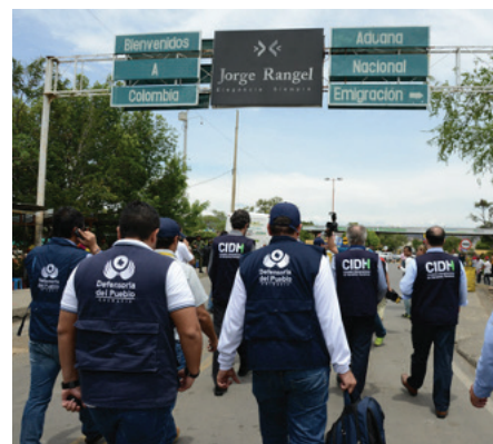
EN LA FRONTERA CON VENEZUELA.