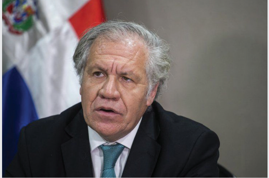
LUIS ALMAGRO, SECRETARIO GENERAL DE LA OEA.

“Invocamos nuevamente el Tratado Interamericano de Asistencia Recíproca (TIAR), y al principio suscrito por la Organización de las Naciones Unidas de Responsabilidad para Proteger (R2P) ... En este contexto, es indispensable una operación de paz multifacética, la cual no debe necesariamente estar bajo la égida de una de una sola organización. Existen experiencias en las que se han constituido coaliciones de organizaciones y países aliados que han sido exitosas”, finaliza ■