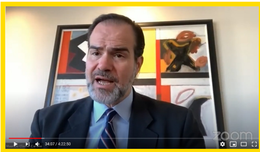
El presidente del Banco Interamericano de Desarrollo Mauricio Clavier Carone durante su participación en el V Diálogo Presidencial del Grupo IDEA. (CAPTURAS DE PANTALLA)

En esta tarea, de acuerdo con Claver-Carone, se está “trabajando en forma estrecha con el Banco Mundial”. Sostuvo que es el momento de sentar las bases para alcanzar una de las economías más sólidas en la región y agregó que América Latina tiene la mayor brecha de financiamiento en todo el mundo. Claver-Carone exaltó los recientes anuncios de la fabricación de dos vacunas que tienen altos porcentajes para contrarrestar el coronavirus. “Esto nos llena de esperanza”, subrayó