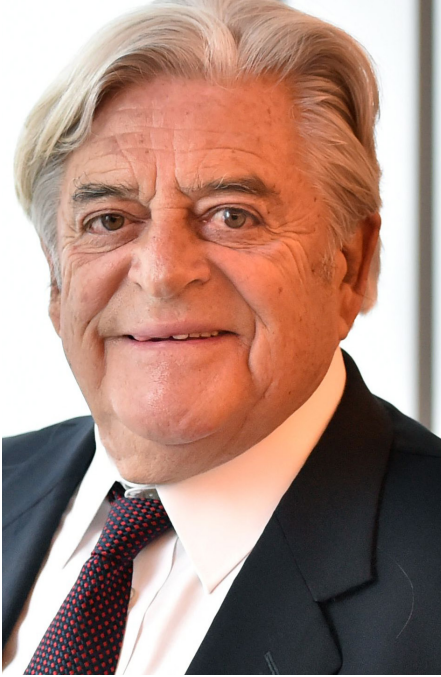
LUIS ALBERTO LACALLE, EXPRESIDENTE DE URUGUAY

“La declaración de Madrid debe llevarnos, como preámbulo, a cosas concretas. El tema de la pandemia es el adecuado, pues no hay homogeneidad política en la región. El Foro de San Pablo y el Grupo de Puebla avanzan para crear conflictos en nuestros países. Ellos también juegan. El populismo es una patología del sistema democrático y debemos estar alertas, pues en las crisis es una salida que llena el ojo de la gente. Se comienza con elecciones legítimas para luego degenerar en lo señalado. Esos grupos mencionados, del que forman parte otros expresidentes y hasta presidentes, en sus documentos hacen constar que trabajan planificadamente para profundizar las divisiones y fomentar los reclamos identitarios exacerbándolos para hacer desaparecer las identidades nacionales. Hay fuerzas actuantes en el mundo que están ocupadas de debilitar los sistemas democráticos y quebrantar o quebrar las sociedades en cada uno de nuestros países. Eso está documentado en las mismas páginas web que usan dichos actores, desde América Latina” ■