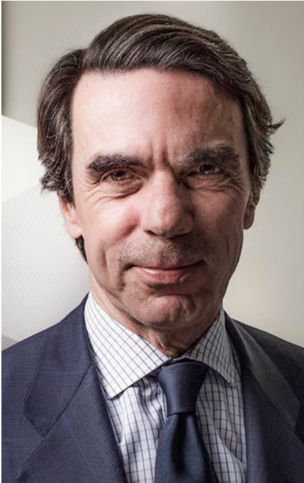
JOSE MARÍA AZNAR, EXPRESIDENTE DEL GOBIERNO ESPAÑOL

“América Latina como consecuencia de la pandemia también existe. La pandemia global no puede dejarla marginalizada. El retroceso estructural en todo el mundo está afectando a las sociedades más vulnerables, a la economía y al Estado de Derecho con efectos sociales en pérdidas de empleo y destrucción de clases medias que son el pilar de las sociedades democráticas con aspiración al desarrollo. Se necesita una salida ofensiva, no defensiva, desde la región iberoamericana. En lo político, la aproximación latinoamericana a las tendencias de la globalización no puede ser desde el autoritarismo, el populismo, el intervencionismo, ni en aquellos factores que hacen que las sociedades dejen de ser democráticas y pasen a ser dependientes. La salida debe basarse en la libertad, en la pluralidad, en la flexibilidad, en la apertura, en el libre comercio, en todo aquello que genera estabilidad, prosperidad y oportunidades para las personas. Y eso se basa desde el punto de vista económico y social en la idea de que se necesita un crecimiento, pero un crecimiento en libertad, generador de empleos y oportunidades para todos en economías sanas, y considerando los elementos innovativos como la transición energética en curso, la educación como base para prosperar, y la revolución tecnológica y digital” ■