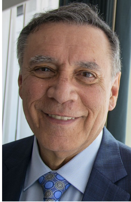
JAMIL MAHUAD, EXPRESIDENTE DE ECUADOR

“El documento expuesto por Aznar tiene la virtud de que nos muestra el vecindario. ¿Dónde estamos? Vamos a quedar más pobres, más desiguales, más endeudados, en lo económico-social. En lo político tenemos más frustración, más rabia y furia en muchísimas partes del mundo y tenemos el riesgo de ser cada vez menos democráticos. En lo internacional hemos estado aislados por mucho tiempo y tenemos tres incertidumbres en la región: ¿Cuándo salimos de esto? ¿cuánto va a costar? ¿cómo vamos a salir y hacia dónde vamos a ir? El carácter crítico de la cuestión lo da comprender el nivel de lo que nos jugamos que es la vida de las personas, hay mucha incertidumbre y sólo podemos confiar parcialmente en las informaciones, y la necesidad de actuar con urgencia. Y estamos fatalmente obligados a elegir. Pero sólo podremos salir de esto con un nuevo paradigma. ¿Nos sirven los paradigmas anteriores al COVID? Me parece que no. Tenemos que llegar a un nuevo contrato social. Y coincido con la preocupación de mis colegas los expresidentes: Cuidado de que el COVID se convierta en el caballo de troya para la corrupción, el narcotráfico, los autoritarismos, en fin, para sacrificar a la democracia. Obviamente que la pandemia reclama de acciones inmediatas, pero previniendo que no se vuelva un pretexto para los despropósitos” ■