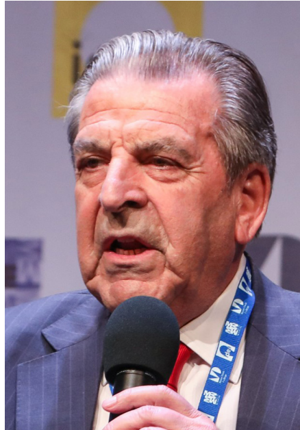
EDUARDO FREI, EXPRESIDENTE DE CHILE

“América Latina como consecuencia de la pandemia también existe. La pandemia global no puede dejarla marginalizada. El retroceso estructural en todo el mundo está afectando a las sociedades más vulnerables, a la economía y al Estado de Derecho con efectos sociales en pérdidas de empleo y destrucción de clases medias que son el pilar de las sociedades democráticas con aspiración al desarrollo. Se necesita una salida ofensiva, no defensiva, desde la región iberoamericana. En lo político, la aproximación latinoamericana a las tendencias de la globalización no puede ser desde el autoritarismo, el populismo, el intervencionismo, ni en aquellos factores que hacen que las sociedades dejen de ser democráticas y pasen a ser dependientes. La salida debe basarse en la libertad, en la pluralidad, en la flexibilidad, en la apertura, en el libre comercio, en todo aquello que genera estabilidad, prosperidad y oportunidades para las personas. Y eso se basa desde el punto de vista económico y social en la idea de que se necesita un crecimiento, pero un crecimiento en libertad, generador de empleos y oportunidades para todos en economías sanas, y considerando los elementos innovativos como la transición energética en curso, la educación como base para prosperar, y la revolución tecnológica y digital” ■