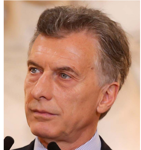
MAURICIO MACRI, EXPRESIDENTE DE ARGENTINA

“En América Latina vivimos una crisis institucional de la más alta profundidad. Nadie cree en los partidos políticos, nadie cree en las instituciones, los parlamentos están desprestigiados. Incluso la Iglesia de nuestro mundo está en el suelo. Tenemos un populismo rampante, de ultraderecha y de ultraizquierda que está destruyendo a nuestras democracias, porque se ofrece y se pide lo que nos es posible hacer, incluso, en los términos de la pospandemia. No tenemos integración de América Latina. No podemos seguir aislados del mundo. ¿América Latina no existe? Tenemos a seis de los países más contaminados del mundo y no hemos tenido capacidad para entendernos entre nosotros, sólo disputándonos entre quién es el más malo o el mejor. Hay grandes bloques en el mundo y nosotros seguimos divididos. Europa acaba de pedir un tratado para enfrentar las futuras pandemias. ¿Y nosotros? Comencemos por algo. Solos y aislados no vamos a poder enfrentar los desafíos del crecimiento como nos lo proponemos. El problema es que no sabemos quien gobierna entre nosotros. ¿Gobierna la calle, gobiernan las redes? Hay países nuestros que siguen gobernándose como en las sombras. Lo estamos viendo con la crisis del Perú, e incluso en Estados Unidos con un gobierno que se aferra al poder. Lo evidente es que tenemos que trabajar en conjunto y ponernos de acuerdo, al menos para salir de la pandemia” ■