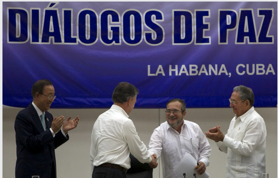
EL PRESIDENTE JUAN MANUEL SANTOS Y EL LÍDER DE LAS FARC, ALIAS 'TIMOCHENKO' JUNTO A RAÚL CASTRO, AL LLEGAR A UN ACUERDO DE JUSTICIA TRANSICIONAL, 2015