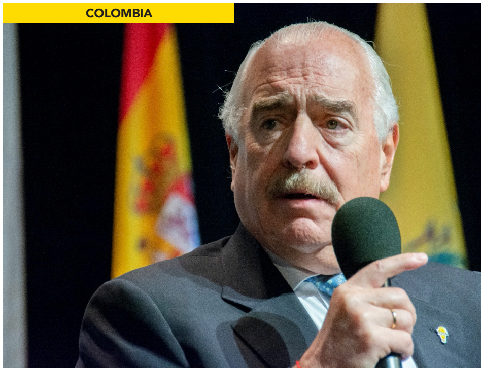
ANDRÉS PASTRANA, EXPRESIDENTA DE COLOMBIA (1998-2002)