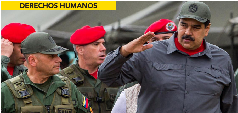
NICOLÁS MADURO, ACUSADO DE CRÍMENES DE LESA HUMANIDAD.