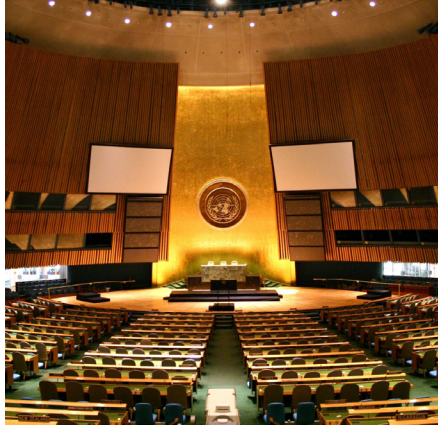
ASAMBLEA GENERAL DE LA ONU

“Si el éxito o el fracaso de la ONU se mide por si ha ayudado a prevenir una Tercera Guerra Mundial, entonces ha tenido éxito. Sin embargo, esto no se ha logrado mediante una gestión positiva de la paz entre las principales potencias, sino por la inacción institucional que establecieron los fundadores en su constitución, a través de un órgano ejecutivo, el Consejo de Seguridad, que no puede tomar medidas contra ninguno de los miembros permanentes ... Así que la Carta de las Naciones Unidas ha ayudado a cimentar una paz global muy básica, apoyada en la disuasión nuclear. Pero en términos de prevención o al menos reducción de guerras y conflictos más localizados, el historial de la ONU es pobre. La actual crisis de financiamiento, liderada por los Estados Unidos, ... afecta particularmente su capacidad para prestar apoyo económico y social a los estados ... A eso se suma la fragmentación de los esfuerzos de resolución pacífica de conflictos, por ejemplo, en Siria, donde el proceso de Astaná corre paralelo al proceso de Ginebra de la ONU” ■