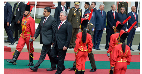
NICOLÁS MADURO Y MIGUEL DÍAZ-CANEL, EN EL PALACIO DE MIRAFLORES.