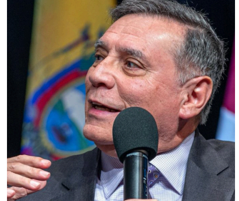
JAMIL MAHUAD EXPRESIDENTE DE ECUADOR (1998-2000)

“Se va hacia el autoritarismo, ahora, de manera gradual... No es una casualidad... Fidel Castro, advirtiendo que por la vía revolucionaria no se llega al poder, fomenta la creación del llamado Foro de Sao Paulo y sus derivaciones, a través de cuyo plan el presidente Chávez y el presidente Lula – emblemáticos en ese sentido – usan la vía de la legitimidad de origen y ejercen el poder sin legitimidad de desempeño democrático. No se oculta a ninguno de nosotros que determinadas expresiones de la izquierda son dominantes, cuando no hegemónicas, en la batalla cultural. Lo saben los artistas, los escritores, los periodistas, que cuando salen valientemente a discrepar de lo que es la opinión “legítima” recibida o consagrada, son desaparecidos de los medios cuanto se puede o están olvidados por todo lo que es crítica o comentarios en conferencias, de libros o expresiones culturales que pretenden romper con esa hegemonía de visos totalitarios. Cuando advertimos esta suerte de operación gramsciana, de ocupar la cultura y a través de ella moldear la opinión pública, desde el punto de vista de nuestra concepción – no sólo política, sino económica y cultural – tenemos que revalorizar, repito, el concepto de la libertad y mostrar los defectos de aquellas otras concepciones” ■