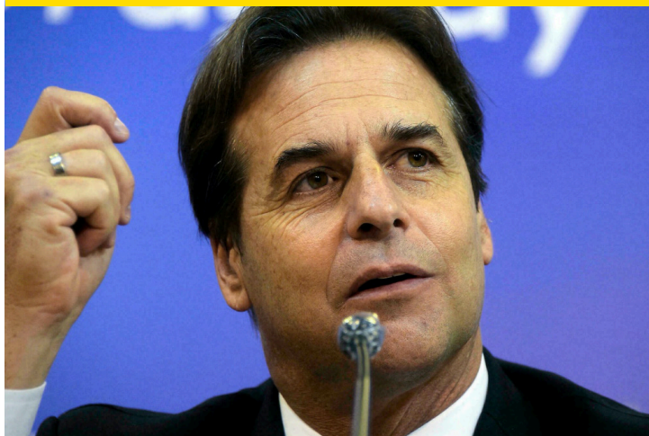
LUIS ALBERTO LACALLE P., PRESIDENTE DEL URUGUAY