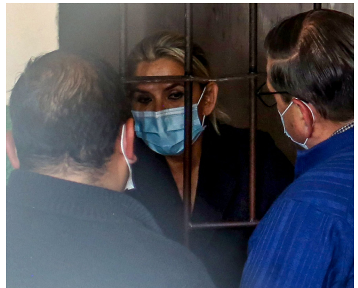
LA EXPRESIDENTA INTERINA DE BOLIVIA JEANINE AÑEZ CONVERSA CON SUS ABOGADOS.