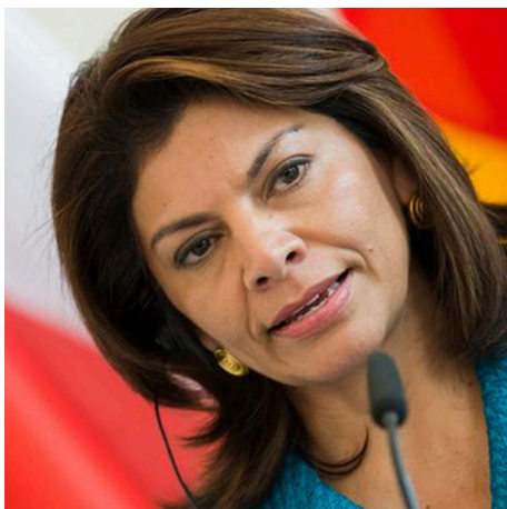
Laura Chinchilla, ex Presidenta de Costa Rica (2010-2014)

El Comité de Relaciones Exteriores le pide a la exgobernante proveerle de recomendaciones y sobre que acciones puede o deba considerar Estados Unidos y la comunidad internacional, para unificar a los países de la región en un esfuerzo serio de defensa de los derechos humanos y promoción de la democracia. El texto de la comunicación, asimismo, le señala considerar las acciones que deban ser coordinadas con la Organización de los Estados Americanos y las Naciones Unidas ■