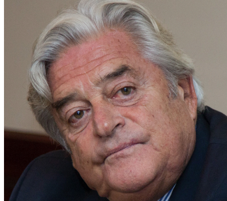
LUIS ALBERTO LACALLE H.

“No quiero dejar de manifestar mi enorme preocupación por las circunstancias y por la situación y la evolución política latinoamericana. La evolución de la mayor parte de los países iberoamericanos es profundamente preocupante. La ausencia de políticas en países relevantes, importantes en la región, como pueden ser los Estados Unidos de América o desde Europa, España, que es especialmente preocupante. Podemos contar con los dedos de la mano, desgraciadamente, los países que están apostando por mejorar sus democracias, asentar sus democracias, sus instituciones liberales y fomentar las reglas fundamentales de la libertad. La mayor parte de los países están en grave riesgo, en grave amenaza o en graves crisis” ■