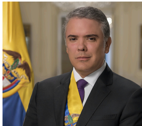
IVÁN DUQUE MÁRQUEZ, PRESIDENTE DE COLOMBIA