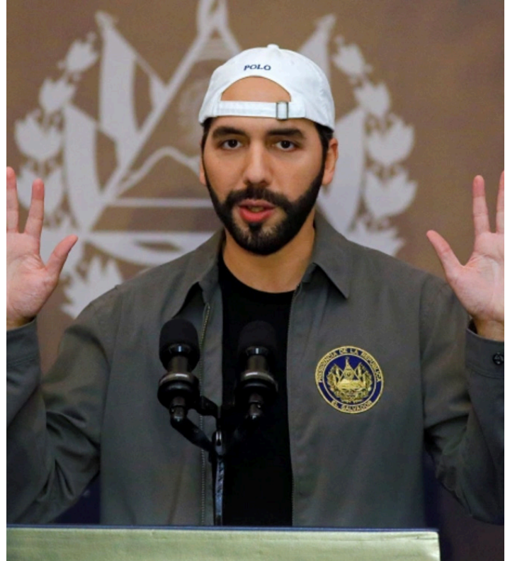
NAYIB BUKELE, PRESIDENTE DE EL SALVADOR

Por consiguiente, estamos a los organismos multilaterales competentes, a la misma ONU y a la OEA, que se han expresado en favor de la alternabilidad en el ejercicio del poder y la limitación de las reelecciones, disponer de sus competencias estatutarias para que el Estado salvadoreño regrese a la senda de la experiencia efectiva de la democracia, de su sujeción al Estado de Derecho, y restablezca, lejos de los fraudes constitucionales y convencionales, las reales garantías de los derechos humanos para todos los salvadoreños ■