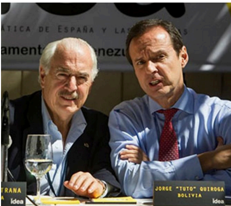
ANDRÉS PASTRANA A. (1998-2002) Y JORGE "TUTO" QUIROGA (2001-2002)

IDEA, así, ha expresado su reconocimiento al presidente de Colombia, Iván Duque, cuyo gobierno presentó la solicitud de opinión consultiva que dio lugar a la mencionada decisión consultiva interamericana, así como a los ex-presidentes Andrés Pastrana de Colombia y a Jorge Tuto Quiroga de Bolivia, impulsores de aquella ( www.idea-democratica.org ), finaliza el comunicado ■