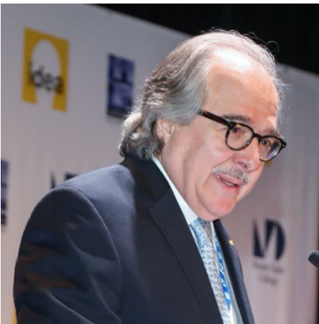
PROF. ASDRÚBAL AGUIAR, J.D. / SECRETARIO GENERAL DE IDEA / MDC

El registro digital del evento puede seguirse, integralmente, a través del link Gobernanza Global ( https://idea-democratica.org/new-page ). De las exposiciones de los catedráticos invitados quedan ideas fuerza que importa destacar ■