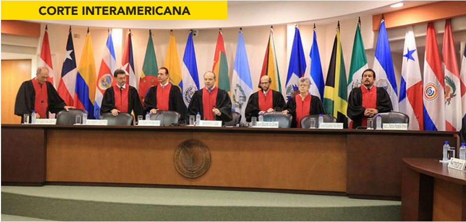
MAGISTRADOS DE LA CORTE, CON SEDE EN SAN JOSÉ DE COSTA RICA