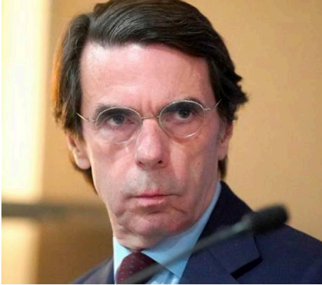
JOSÉ MARÍA AZNAR

“Desde el comienzo de la pandemia, nos hemos dado cuenta de que vivíamos, probablemente, la crisis más grave en el orden internacional después de la Segunda Guerra Mundial. La pandemia lo que ha hecho es acelerar la tendencia, por poner en cuestión lo que ya estaba puesto en cuestión. Y lo que estaba en cuestión era el orden liberal nacido de aquella guerra. La retirada del mundo occidental, la retirada de los EE. UU. en Afganistán, ha confirmado de nuevo, y de una manera muy dramática, los cambios que se están produciendo en la gobernanza global”.