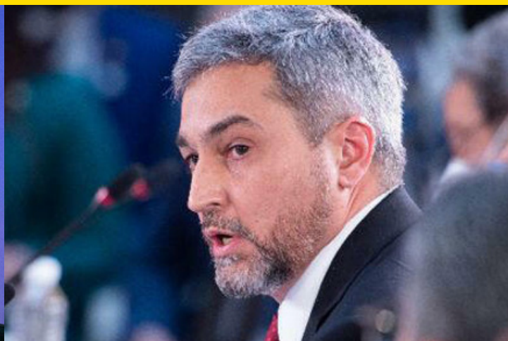
MARIO ABDO B., PRESIDENTE DEL PARAGUAY