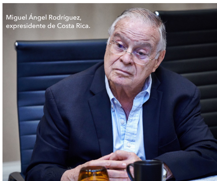
Miguel Ángel Rodríguez, expresidente de Costa Rica.

“Estamos pretendiendo que lo que ahora nos une es un mapa, mancomunados todos por una carta geográfica, pero nuestra unidad en las Américas tuvo su fundamento histórico – como en Europa – en la idea de la libertad” Jorge “Tuto” Quiroga