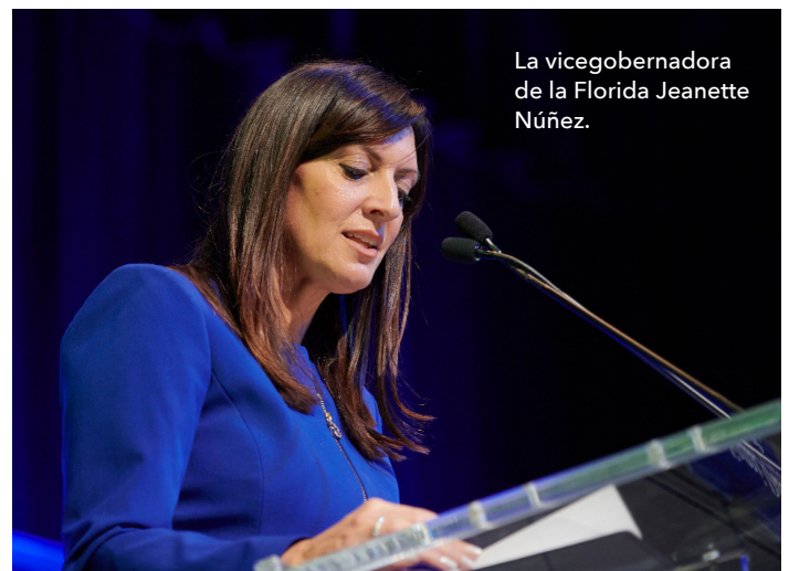
La vicegobernadora de la Florida Jeanette Núñez.