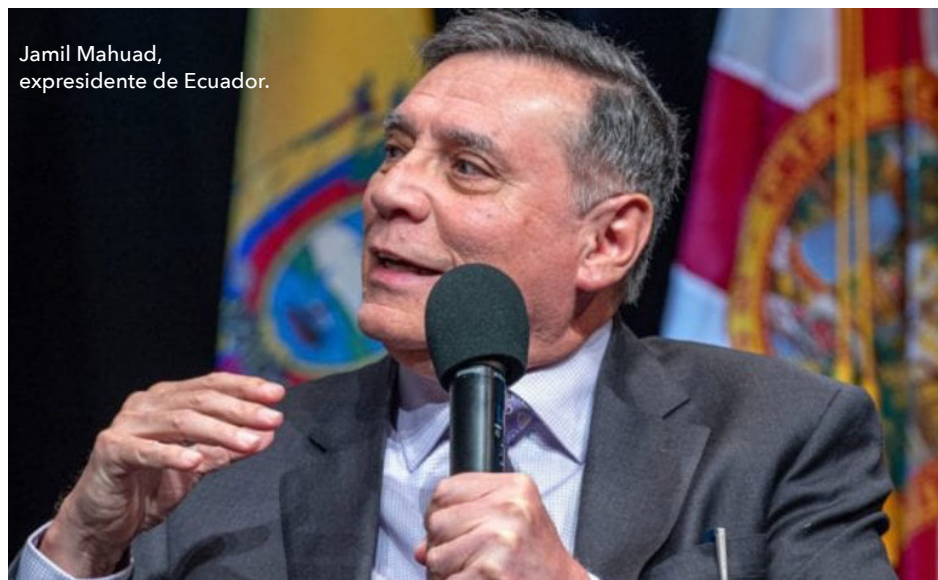
Jamil Mahuad, expresidente de Ecuador.

“Estamos pretendiendo que lo que ahora nos une es un mapa, mancomunados todos por una carta geográfica, pero nuestra unidad en las Américas tuvo su fundamento histórico – como en Europa – en la idea de la libertad” Jorge “Tuto” Quiroga