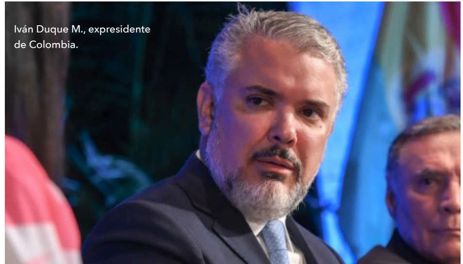
Iván Duque M., expresidente de Colombia.

Iván Duque M., Colombia. Hay que ponerle fin a la hipocresía. ¿Cuál es mayor socio comercial de China en el mundo? Estados Unidos ¿Cuál es el país que tiene la mayor propiedad sobre los bonos de USA? La República Popular China. Pero eso viene desde 1973, como política de Estado. Hoy, nuestros países tienen relación comercial con China y ¿por qué está lle-