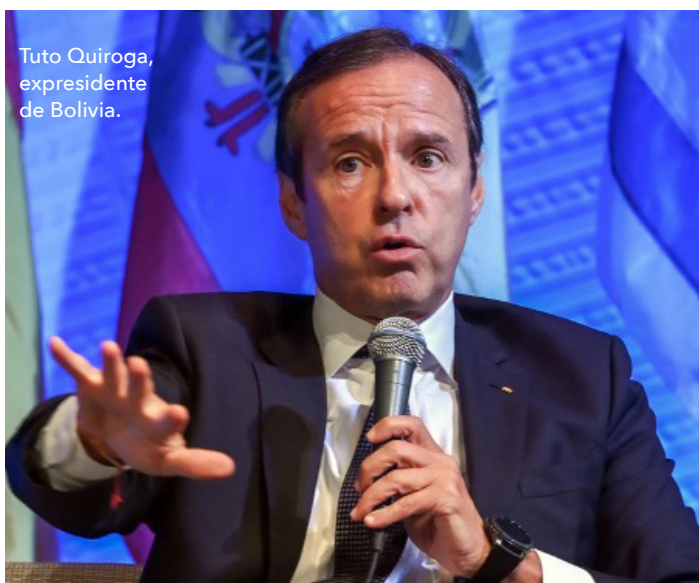
Tuto Quiroga, expresidente de Bolivia.

cracia con la Carta Democrática, pero después no hemos podido aplicarla. Se rompió cuando al nacer el Grupo IDEA en Panamá la Cumbre de las Américas incorpora a Cuba dentro de su seno. Previsión, uso del conocimiento y unir esfuerzos entre trabajadores, empresarios, cultura, iglesias, es el desiderátum. La historia de la libertad ha sido siempre una historia de altos y bajos. Somos un continente de unión de culturas, no de división de culturas, somos hijos del mestizaje.