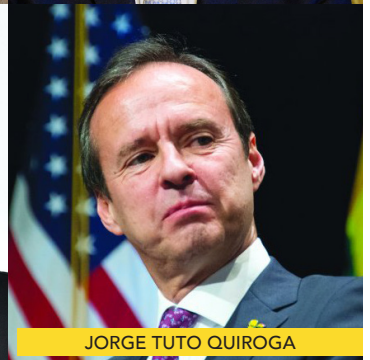
JORGE TUTO QUIROGA