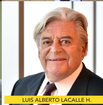
LUIS ALBERTO LACALLE H.