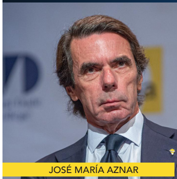
JOSÉ MARÍA AZNAR