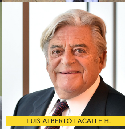
LUIS ALBERTO LACALLE H.