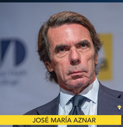
JOSÉ MARÍA AZNAR