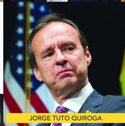
JORGE TUTO QUIROGA